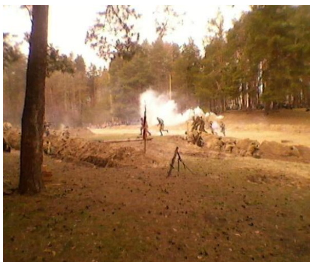
Один день той далёкой войны