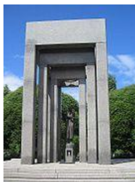
Мемориал ленинградцам-блокадникам на Пошехонском кладбище