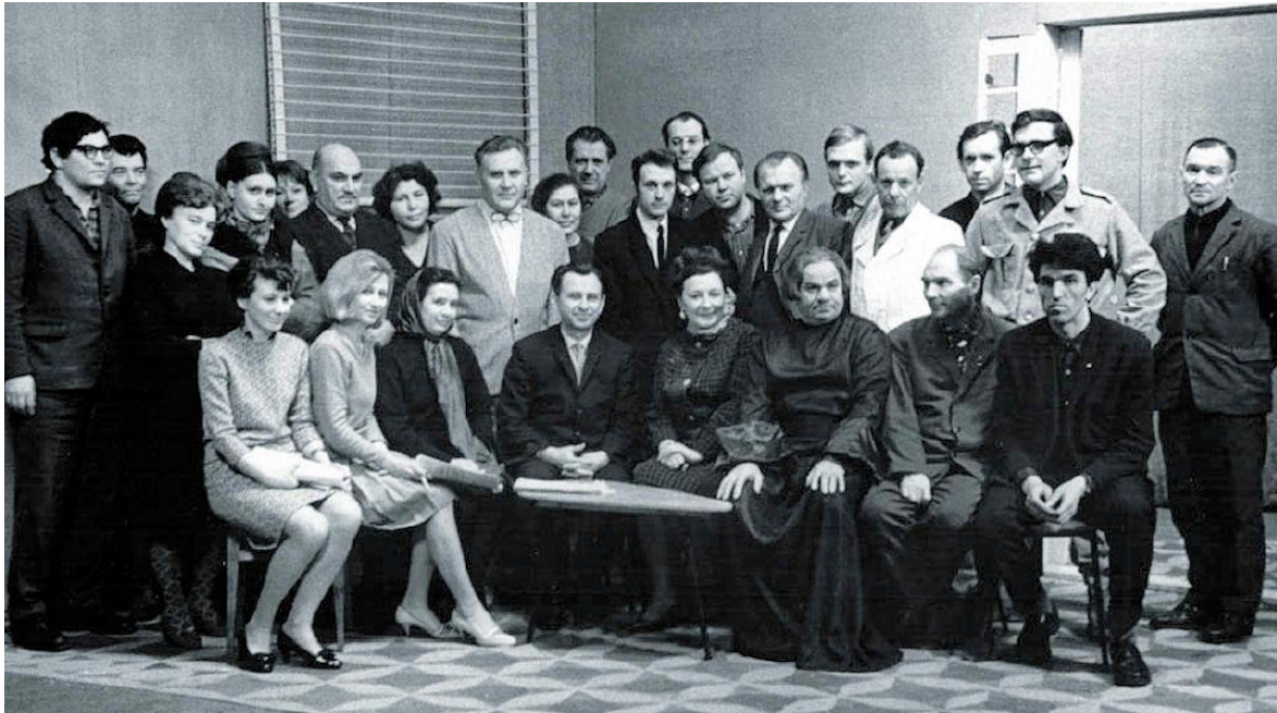
На телестудии после премьеры спектакля "Кактус"

Россиянин Тольц демонстрирует здесь большее непонимание эпохи, людей и обстоятельств, чем американец Стейнбек. Кстати, кроме тех самых «секретных дневников» он мог бы почитать документальную повесть Хмарского «Месяц со Стейнбеком» (опубликована в журнале «Волга»).