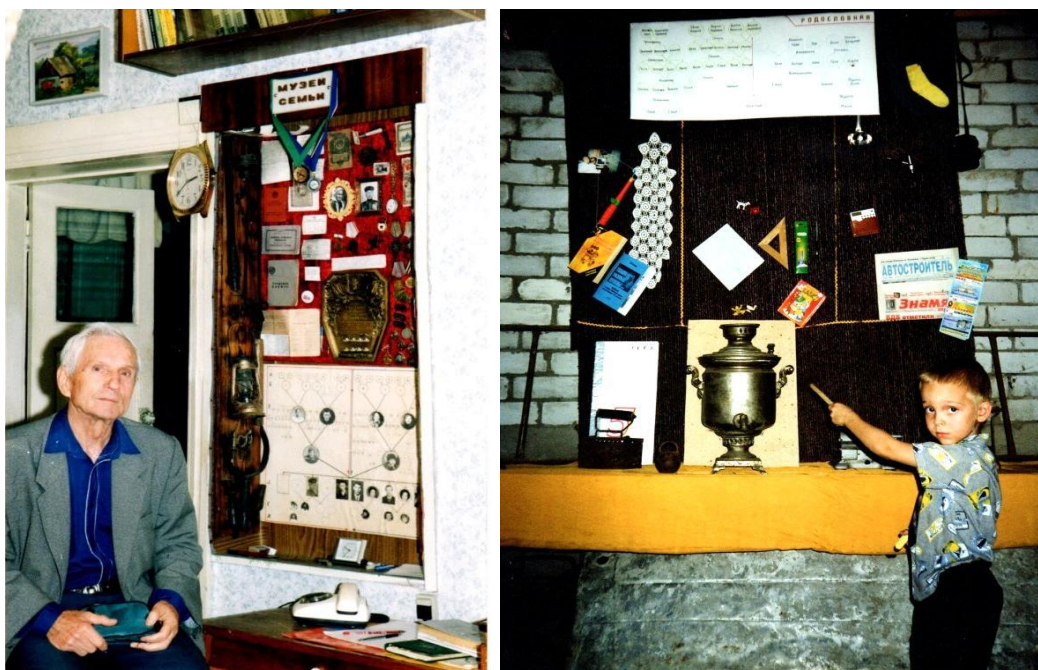
Домашний музей семьи.