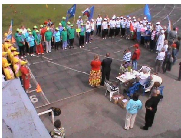
Спартакиада членов Союза пенсионеров России