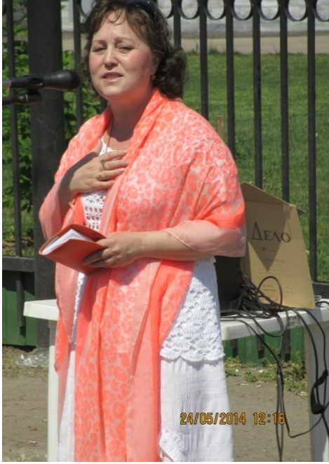
День славянской письменности