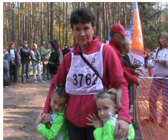
Студенты Университета «София» на «Лыжне России» и «Кроссе наций»