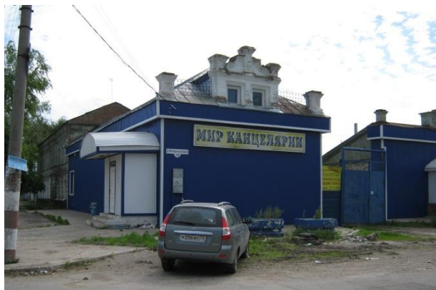
Здание военкомата образца 1941 года