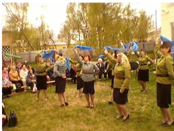
Пенсионеры ЦСО «Доверие» отдыхают