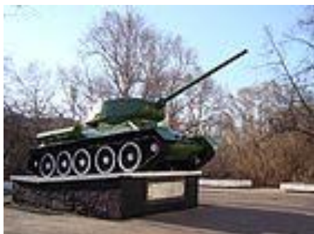
Памятник Т-34 в Вологде. «В честь боевого и трудового подвига вологжан в Великой Отечественной войне 1941-1945 годов»

Кроме того, Вологда регулярно снабжала Ленинградский фронт через свой железнодорожный узел. Жители города осуществляли пожертвования в виде донорской крови, денег и драгоценностей. На деньги вологжан была сформирована танковая колонна «Вологодский колхозник».