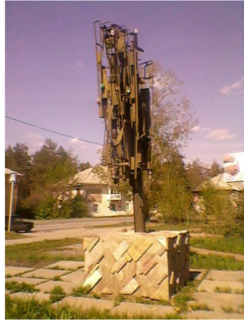
Памятник местной культуре из металлолома

«Трубач революции» – это народное название памятника погибшим красноармейцам, защищавшим город от белочехов в 1918 году. Находится на мемориальном кладбище в центре города между улицей имени В.В. Куйбышева и речкой Мелекесской. Ещё точнее – напротив бывшего парка культуры и отдыха имени В.И. Ленина. Но чтобы имя Ленина не упоминалось и забылось, недавно в этом парке построили аж две церкви, которые для солидности именуются соборами, а в настоящее время возводится здание епархиального управления.