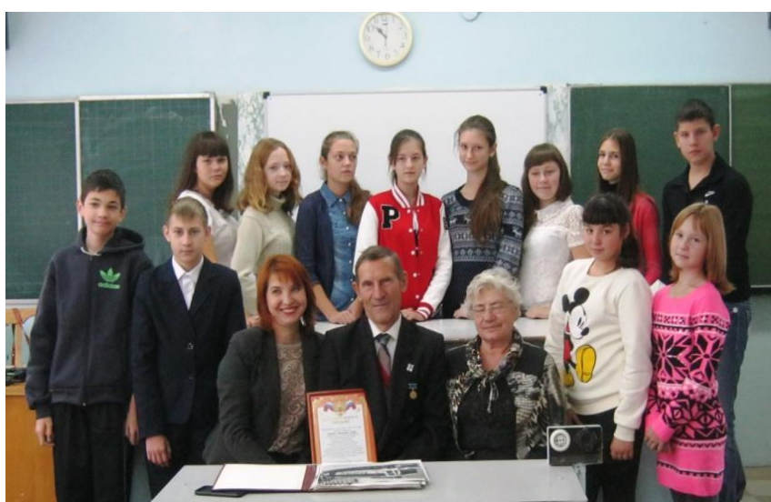
Уроки литературф и здорового образа жизни в школе