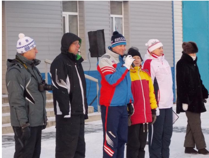
Спортсменов приветствует чемпион Олимпийских Игр Сергей Фокичев

Заодно отчитаюсь о спортивных выступлениях за прошедший зимний сезон от ноября 2013 года до июля 2014 года. Занял второе место в мемориале Олега Гончаренко (Коломна, ноябрь), третье место в мемориале Евгения Гришина (март, Москва), второе место в Кубке Москвы (декабрь), первое место (золотая медаль и кубок) в чемпионате Чувашской Республики (Новочебоксарск, апрель), три золотых и одна бронзовая меда-