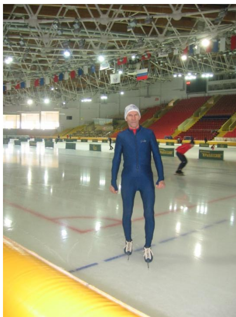
В Ледовом дворце «Крылатское», г. Москва

В первом томе я писал, что «муссируется миф о том, что вот-вот построят каток с искусственным льдом у нас в Дмитровграде. И предсказал будущее на ближайшие 50 лет: это всего лишь красивая сказка и не более.