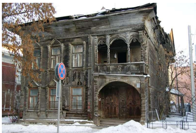
Домик Петра I

После окончания Смуты Вологда переживает новый расцвет. В конце XVII века, по численности дворов она уступала лишь Москве и Ярославлю.