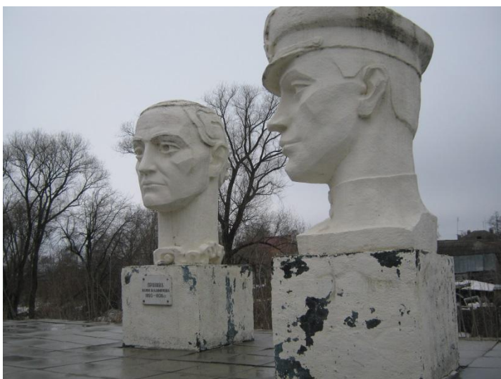
Вид на мелекесский некрополь