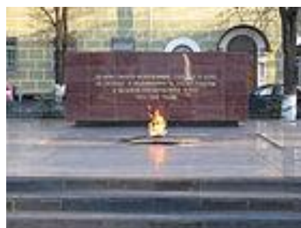
Вечный огонь на Площади Революции в память о вологжанах, павших в боях Великой Отечественной войны

Там же установлен памятник героям Октябрьской революции и Гражданской войны на площади Революции