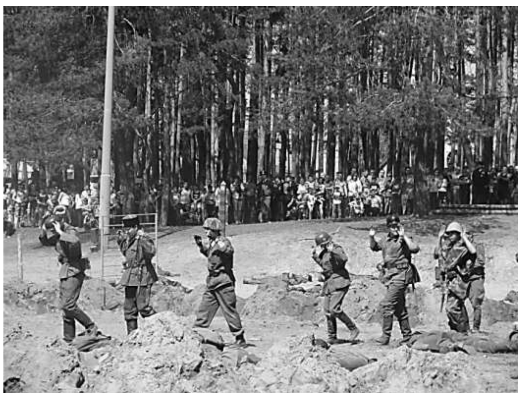
Один день той далекой войны