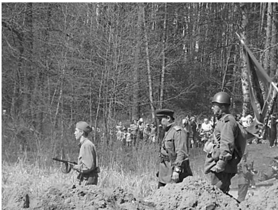
Один день той далекой войны