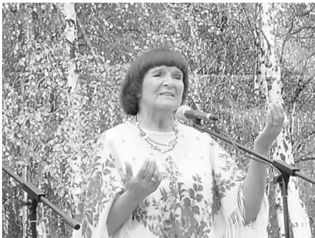
Культурная программа фестиваля