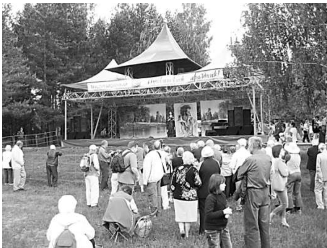
Пушкинский праздник в Захарово