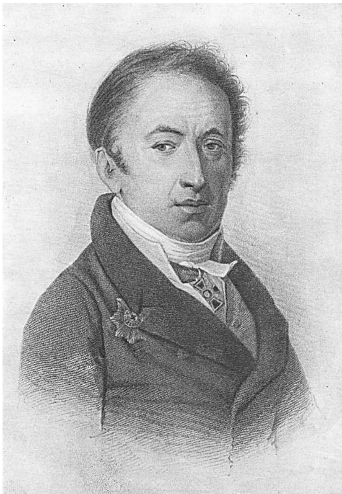
Николай Михайлович КАРАМЗИН