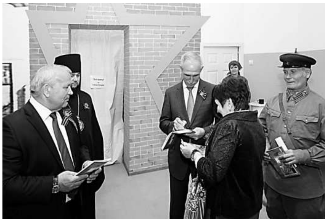
Открытие музея «Райвоенкомат»