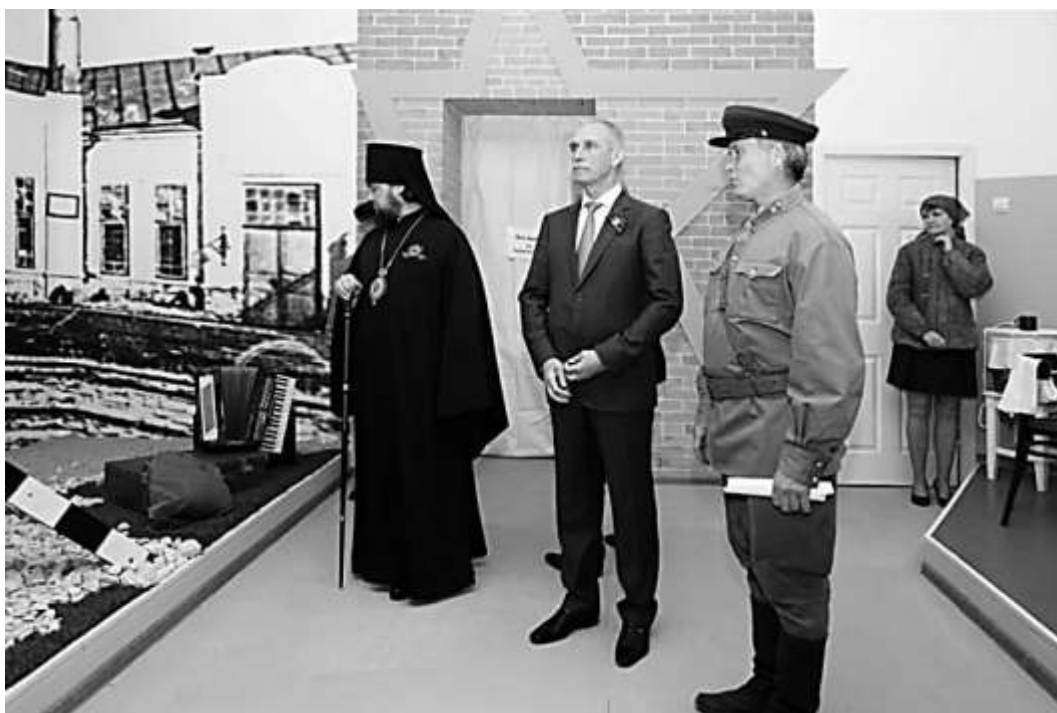
Открытие музея «Райвоенкомат»