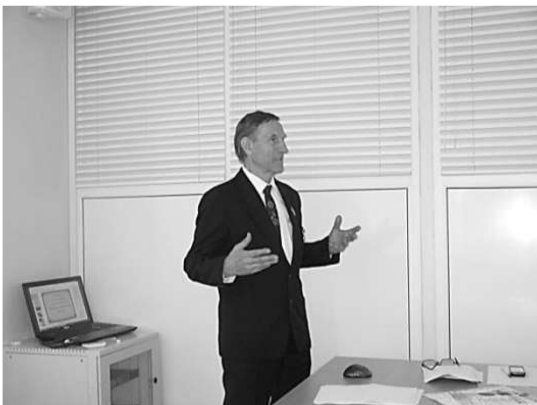
Визит в школу № 19