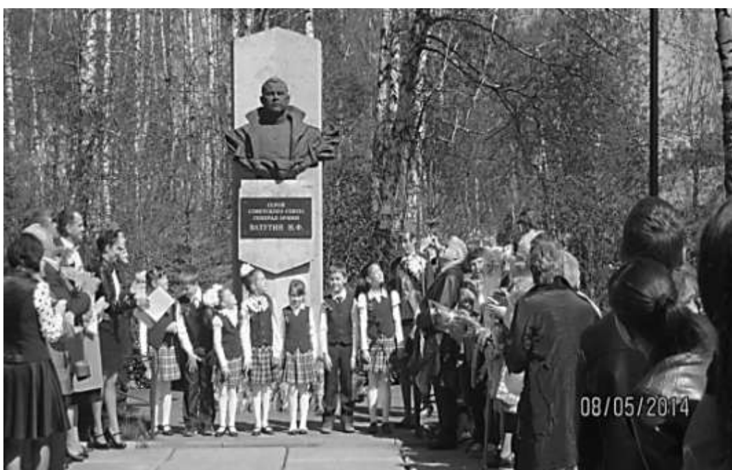
Торжественный митинг у памятника Н.Ф. Ватутину

Напомню, что генерал-лейтенант танковых войск Василий Баданов, в его честь в городе тоже названа улица, воевал