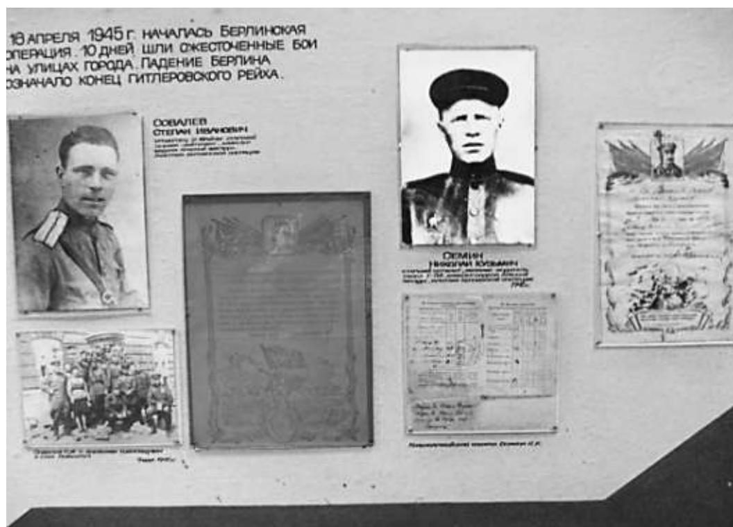
Фрагмент экспозиции «Зал Славы»

Активисты Молодежного инициативного центра, волонтеры молодежного добровольческого движения «Флагман» принимали активное участие в городских патриотических акциях «Память», «Георгиевская ленточка», «Обелиск», «Молодежный десант», «Забота», в ходе проведения которых оказывалась шефская помощь ветеранам войны, труженикам тыла, жителям блокадного Ленинграда, узникам концлагерей, солдатским вдовам. Для надлежащего ухода за памятными и историческими местами города они были закреплены за учреждениями и учебными заведениями.