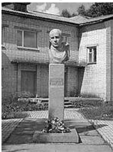
Памятник Н.М. Рубцову в Емецке

В 1962 году Рубцов поступает в Литературный институт имени М. Горького в Москве и знакомится с уже известными писателями В. Соколовым, С. Куняевым, В. Кожиновым и другими литераторами, чьё дружеское участие не раз помогало ему и в творчестве, и в делах по изданию стихов. После окончания был принят в штат газеты «Вологодский комсомолец».