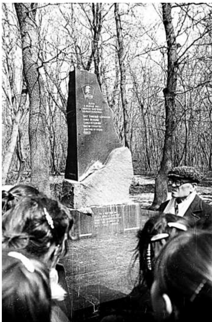
Памятник на могиле молодогвардейцев, Ровеньки

Члены Союза писателей России ежегодно в Краснодаре проводят Фадеевские чтения. И это не просто дань моде. О подвиге молодогвардейцев написаны десятки книг. Всё чаще стали появляться книги, цель которых дегероизировать Краснодарское подполье, принизить патриотизм комсомольцев, лишить современную молодёжь примера для подражания, очернить и переписать героическую историю. Цель чтений – дать отпор таким деятелям. Здоровые силы общества, независимо от наций, религий, продолжает вдохновлять на творческое выражение высших человеческих чувств подвиг краснодонцев. Оперы, спектакли, поэмы, стихи, книги не позволяют исказить правду, защищают её от нападков. Этому посвящены работы писателя Кима Иванцова «Молодая гвардия: правда,