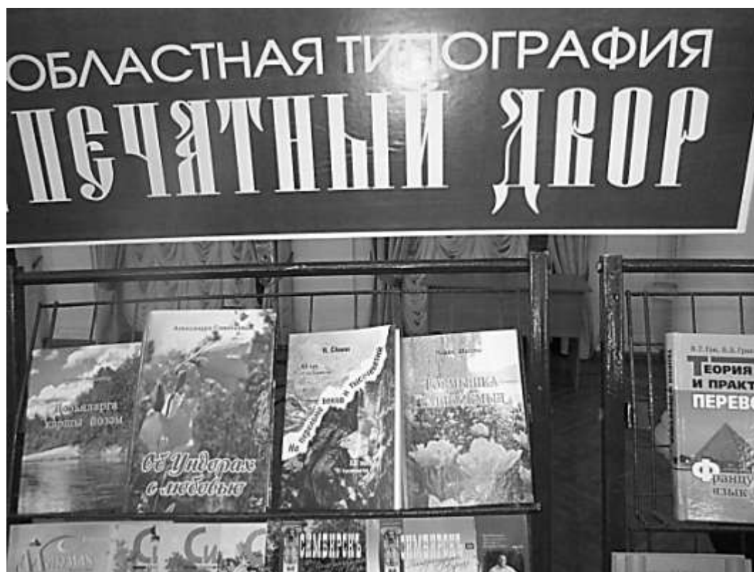
Один из стендов выставки

В апреле 2015 года во Дворце книги областной библиотеки имени Ленина была организована выставка под названием «Симбирская книга-2014».