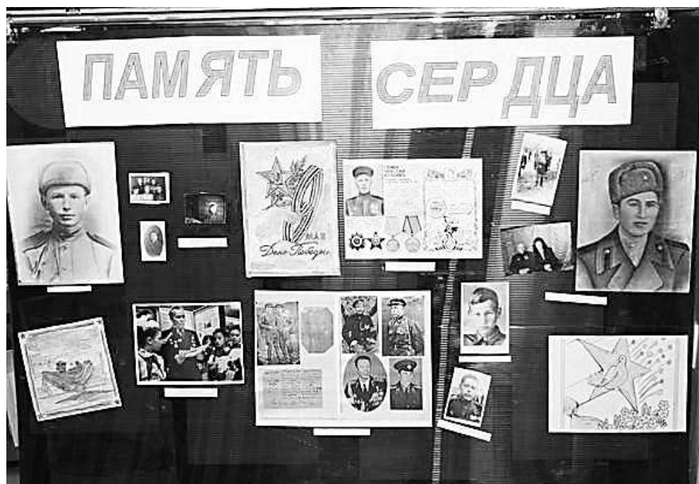
Стенд в офисе центра «Доверие»