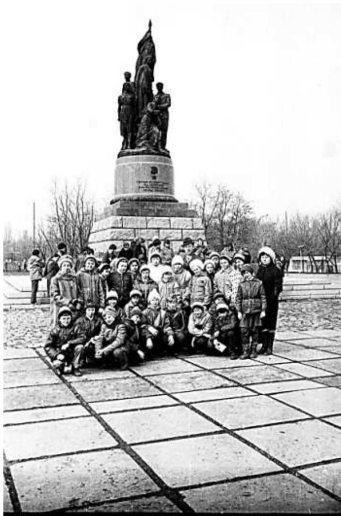
Школьники у памятника «Клятва», Краснодар

В весенние каникулы 1985 года пятый «А» класс школы № 9, в котором училась моя дочь, совершила туристическую поездку в Краснодар. Выбор цели путешествия был не случайным. Пионерский отряд класса носил имя Олега Кошевого, одного из руководителей подпольной группы под названием «Молодая гвардия».