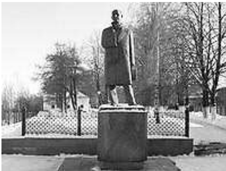
Памятник Николаю Рубцову в Вологде