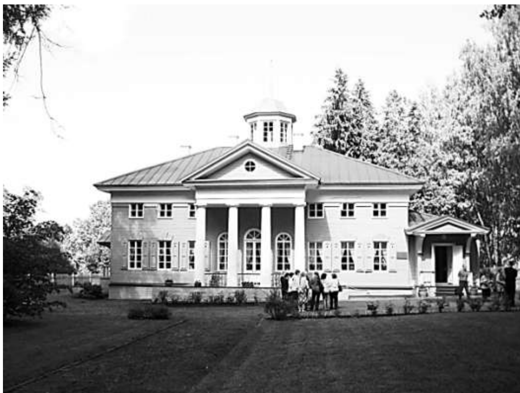
Музей-усадьба в Захарово