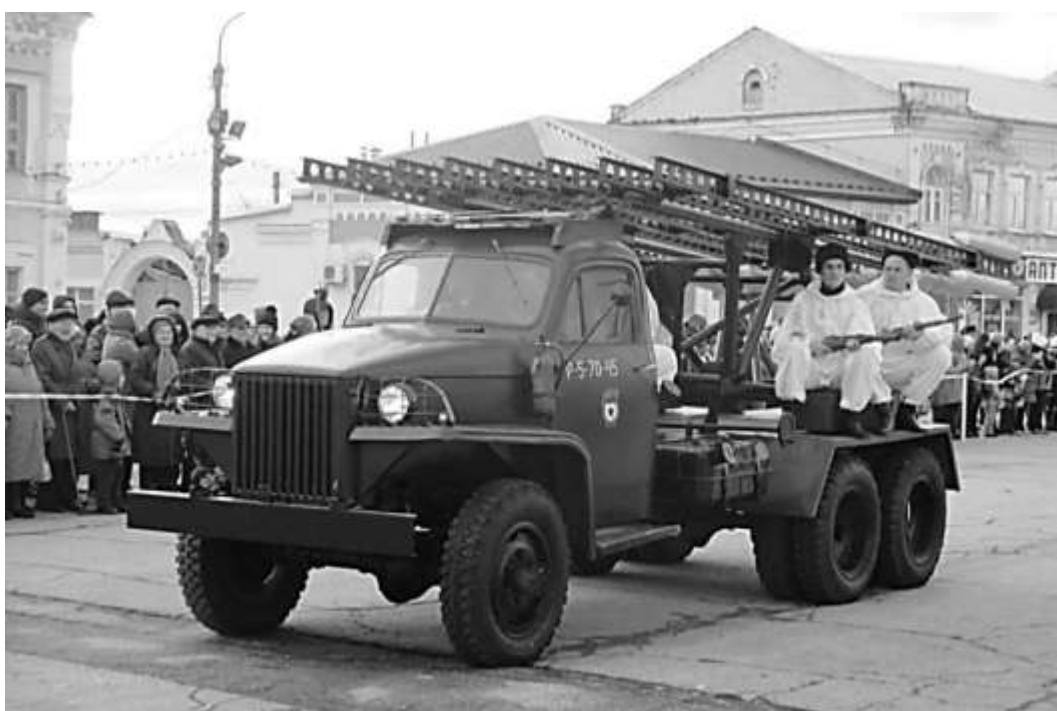
Площадь Советов. Парад Победы