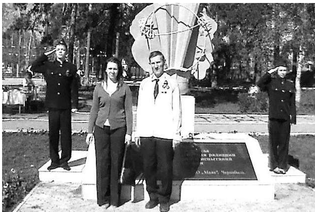
9 мая в Димитровграде