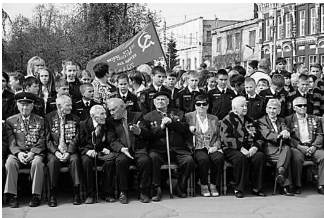
На открытии «Аллеи ветеранов»