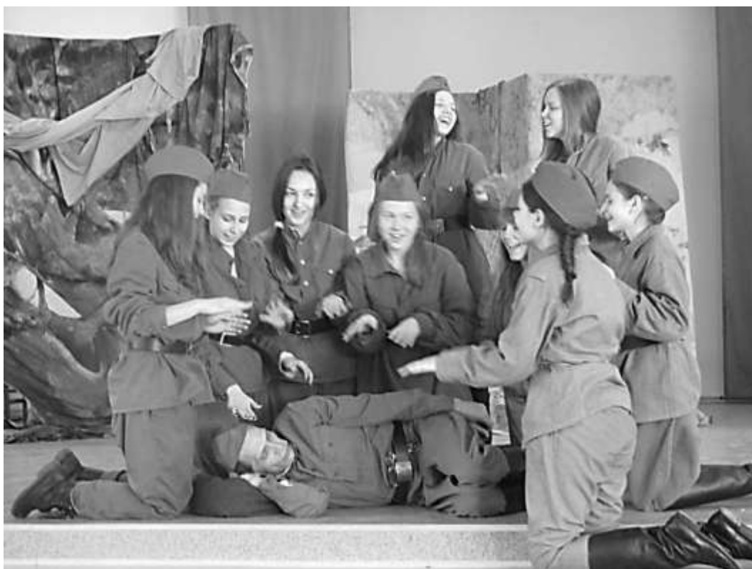
«А зори здесь тихие...»