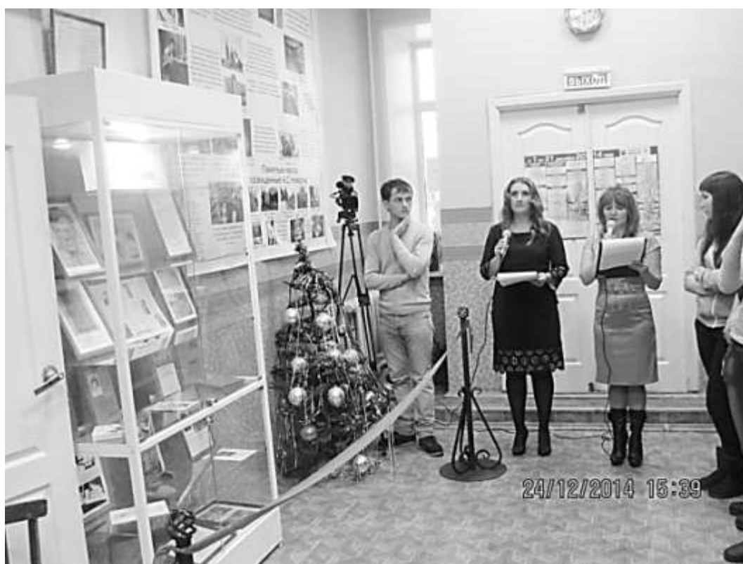
В библиотеке семейного чтения имени Александра Невского