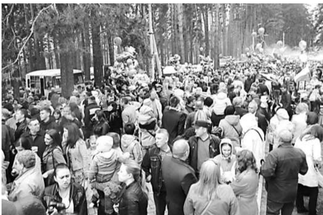
9 мая в Димитровграде