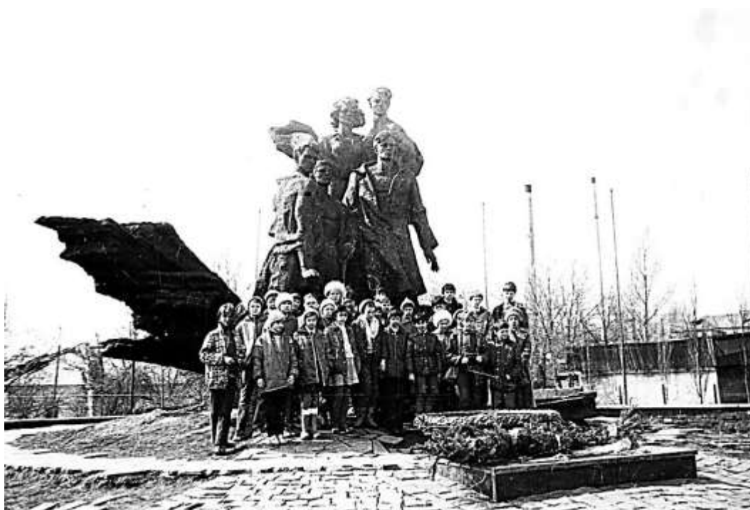
Экскурсия учеников 5а класса школы № 9 Димитровграда на родину героев-красноармейцев