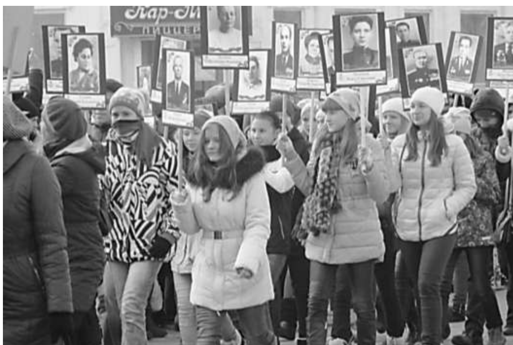
Площадь Советов. Парад Победы