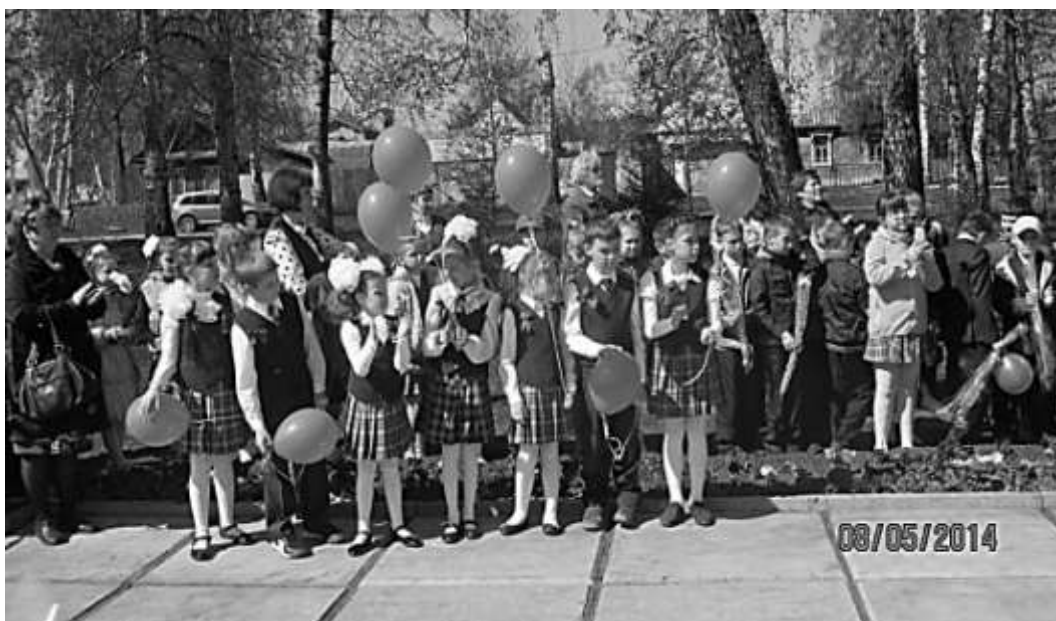
Ученики поздравляют ветеранов с Днем Победы

О подвижках в этом деле пока ничего не известно.