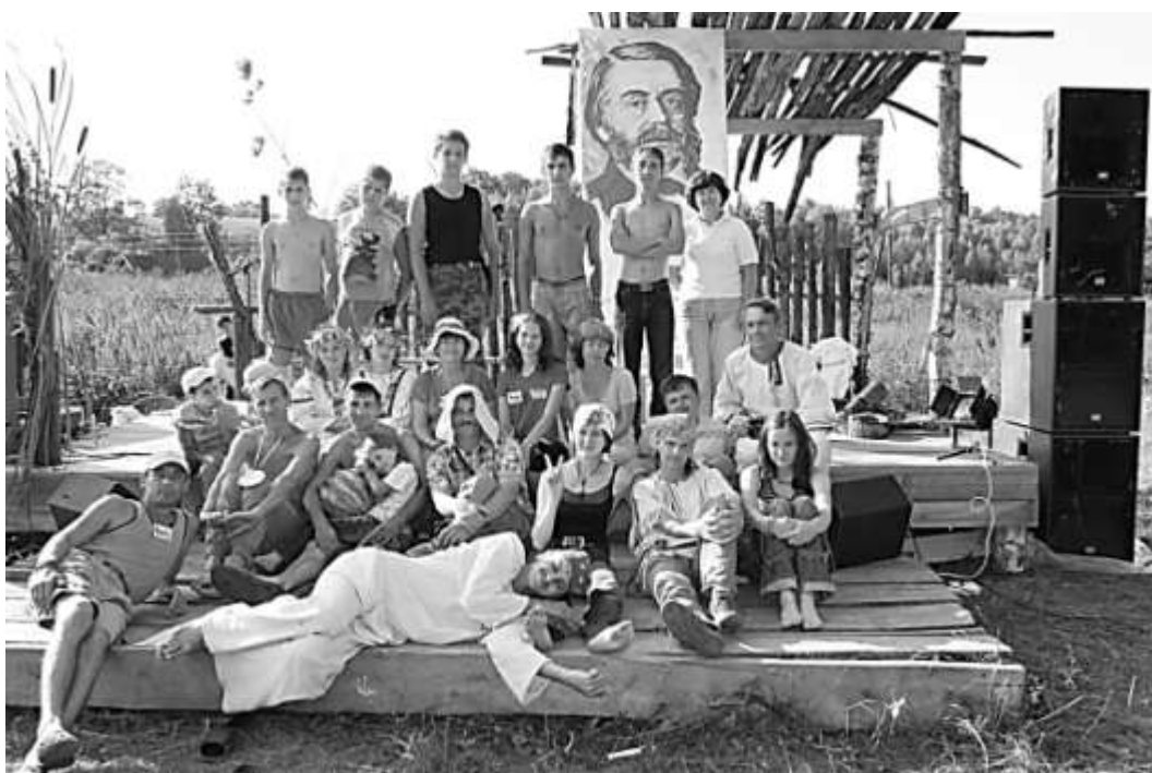
Гончаровские чтения в селе Лопата