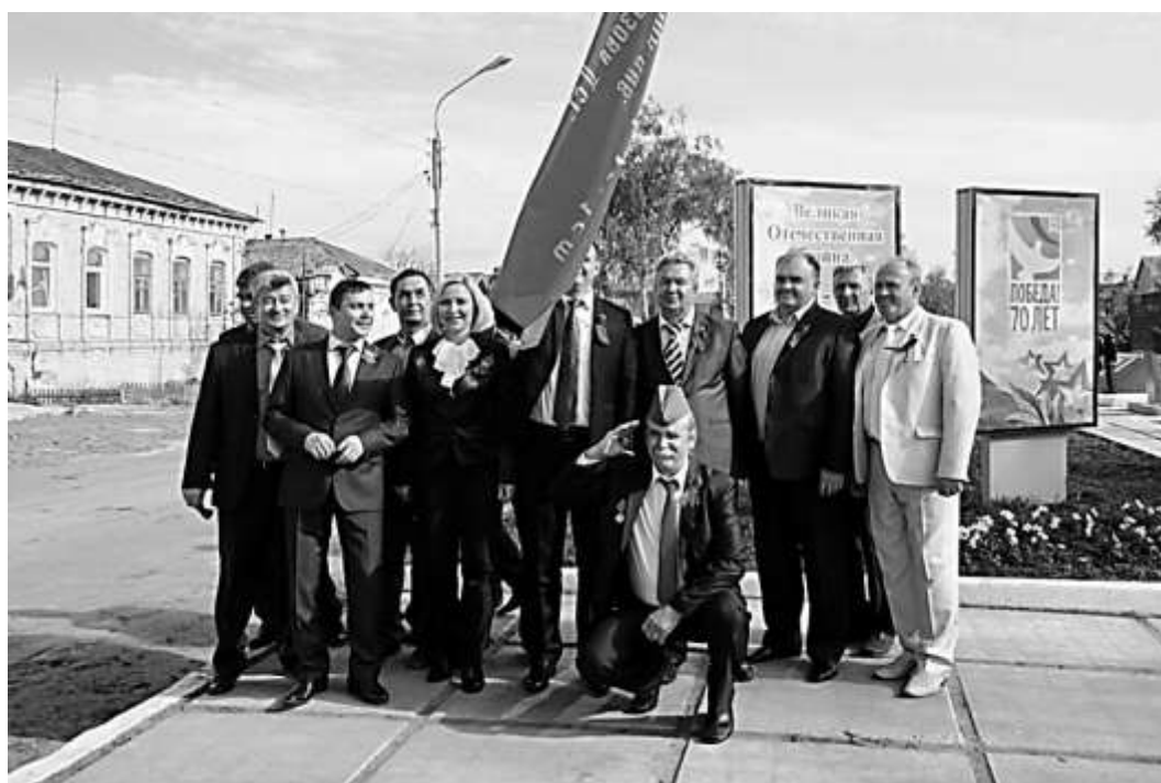
На открытии «Аллеи ветеранов»