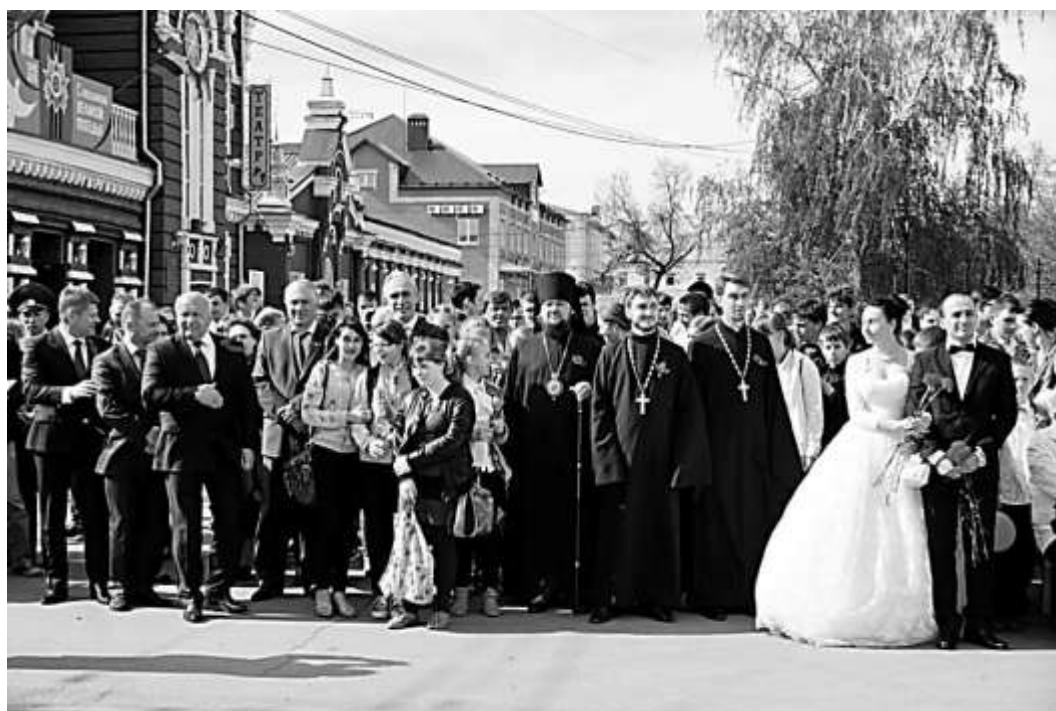
На открытии «Аллеи ветеранов»