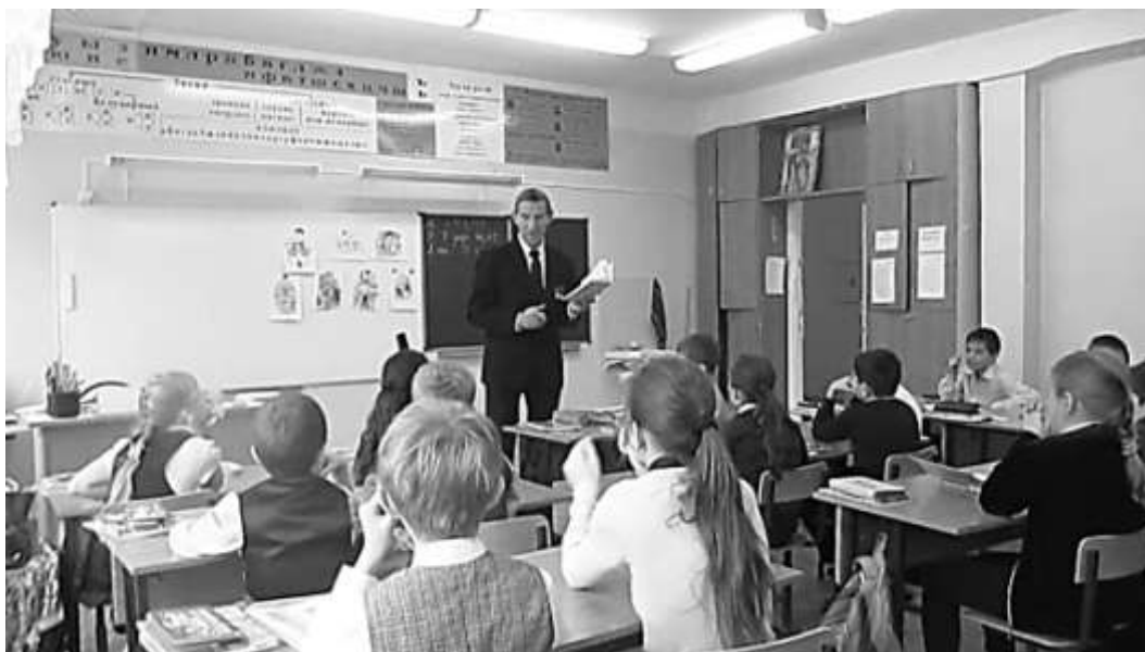
Урок литературы в школе № 9

Я им рассказал о посещении нескольких Пушкинских мест. Например, сельца Захарово под Москвой, где юный Саша с 7 до 11 лет, до поступления в лицей, провёл детские годы со своей бабушкой Марией Алексеевной Ганнибал и няней Ариной Родионовной, продемонстрировал фотографии и слайдфильм.