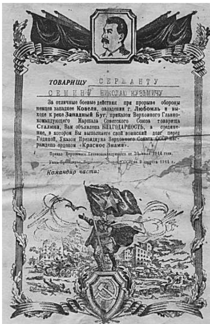
Благодарность Верховного Главнокомандующего И.В. Сталина

Награждён за время боевых действий орденами "Красная Звезда" и "Великая Отечественная война" I-й степени, медалями: "За отвагу", "За боевые заслуги", "За освобождение Варшавы", "За взятие Берлина", "За победу над Германией". Был несколько раз контужен, когда танк подбивали, и ранен лишь осколком в мизинец правой руки. Про это курьёзное ранение папа рассказывал, что произошло это во время боя, когда он открывал свой люк, чтобы покинуть горящий танк. После заживления мизинец остался согнутым, так как в госпиталь он попал через сутки после выхода из боя. Искалеченный мизинец не мешал работать после войны шофёром, так как своим положением не мешал, а даже помогал руке охватывать "баранку" (руль) грузовика. Умер в возрасте 60 лет, лишь один раз получив пенсию.