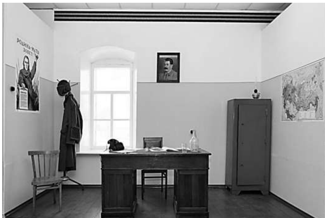
Открытие музея «Райвоенкомат»