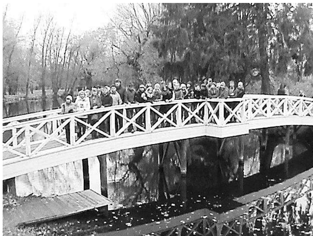
В музее-заповеднике «Болдино»