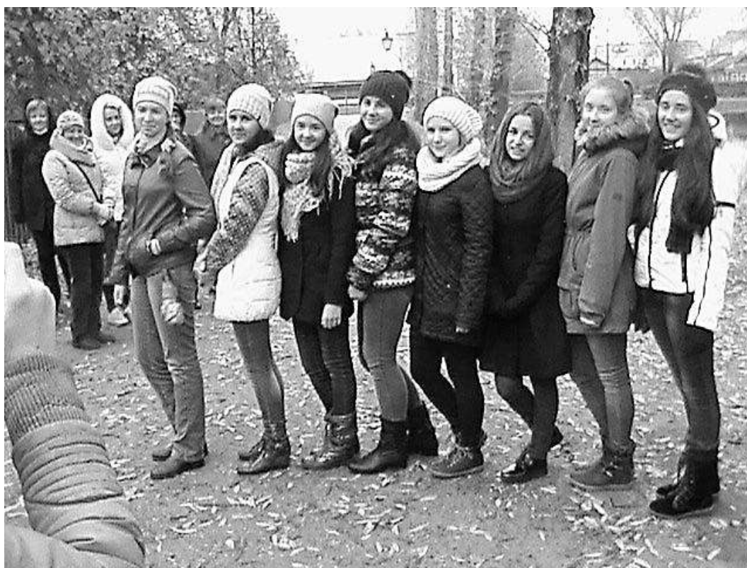
В музее-заповеднике «Болдино»