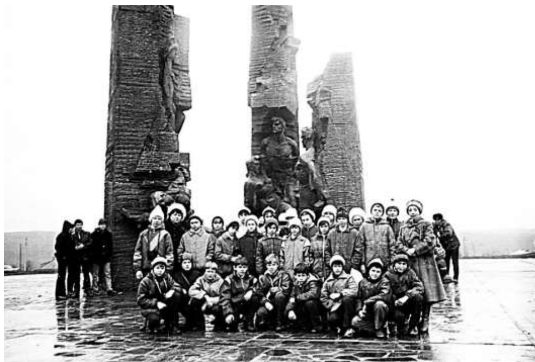
Экскурсия учеников 5а класса школы № 9 Димитровграда на родину героев-красноармейцев