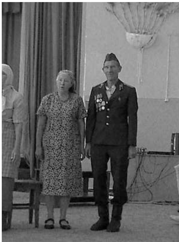
Сцена из спектакля «Дон Жуан в масштабах тыла»

Никанор, разнося печальные вести, старается отвлечь женщин от горя, изображая из себя то жениха, то попридержать «похоронки» до окончания войны – а вдруг кто-то из солдат всё-таки вернётся домой. Поэтому и попадает дед то в