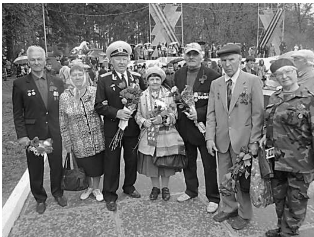
9 мая в Димитровграде