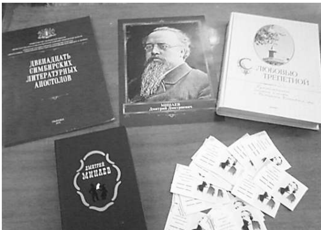
Труды Дмитрия Минаева