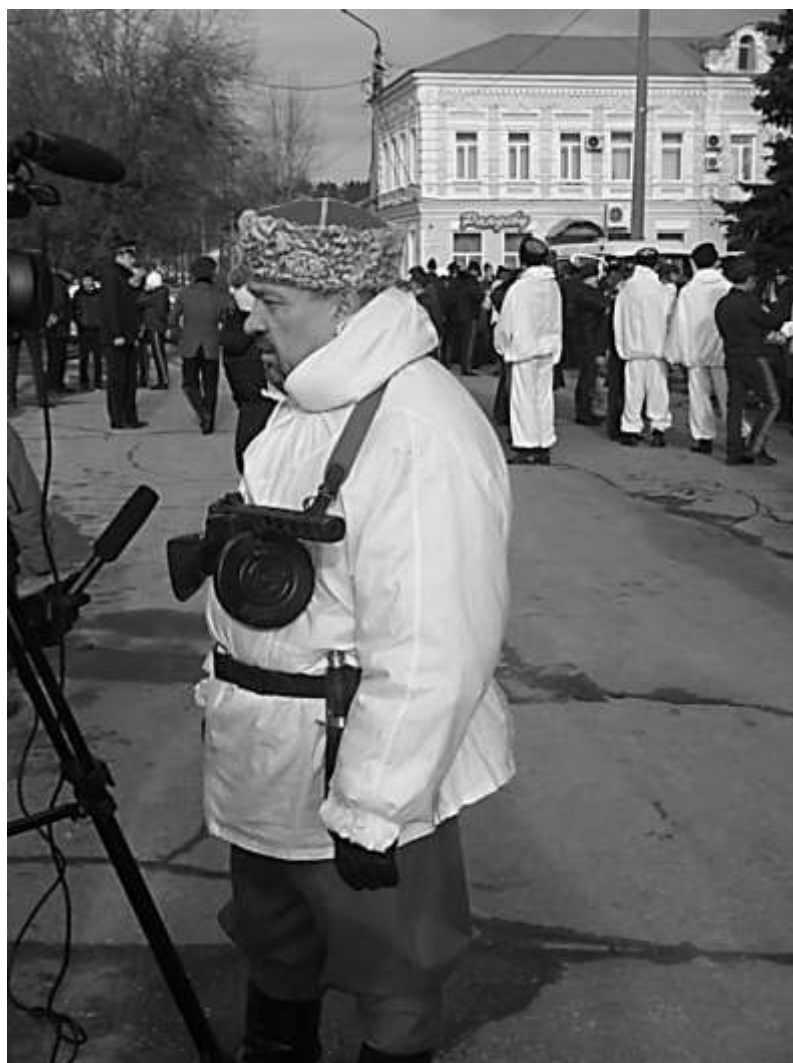
Площадь Советов. Парад Победы