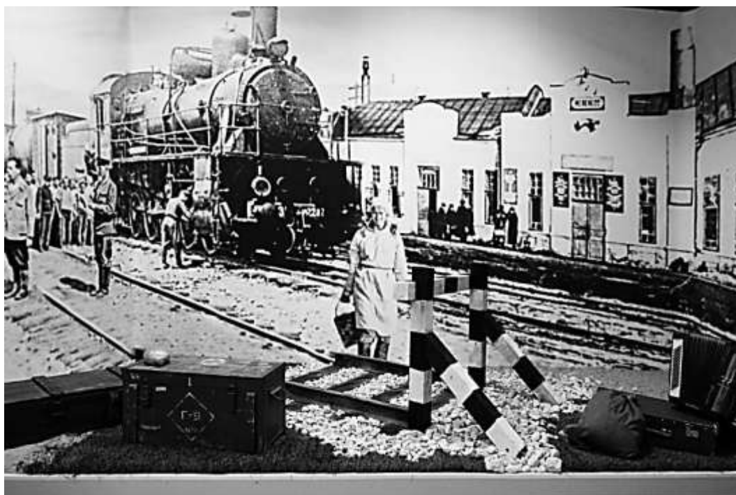
Открытие музея «Райвоенкомат»