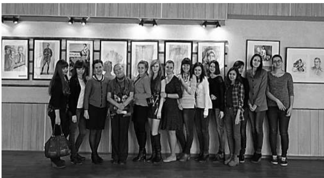
Дизайнеры ДИТИ – участники выставки