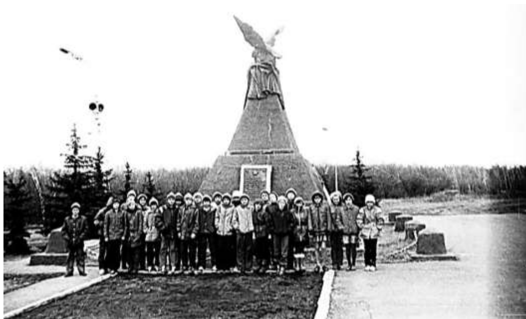
Экскурсия учеников 5а класса школы № 9 Димитровграда на родину героев-красноармейцев