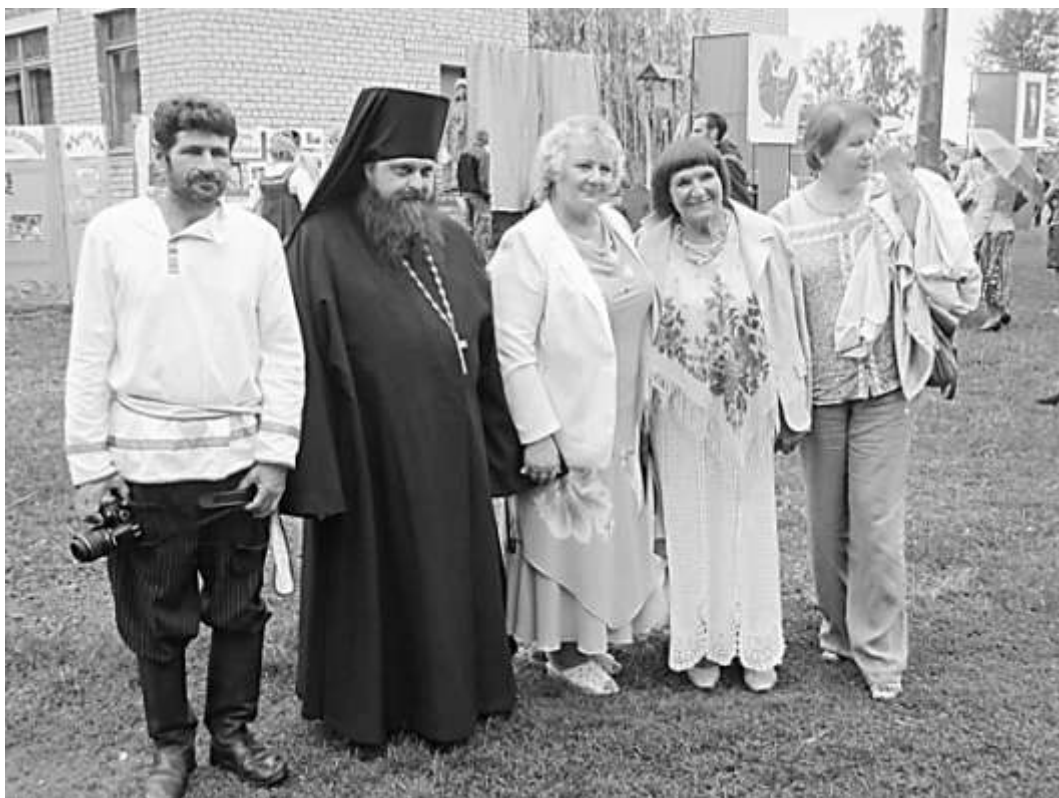
На фестивале в Новиковке