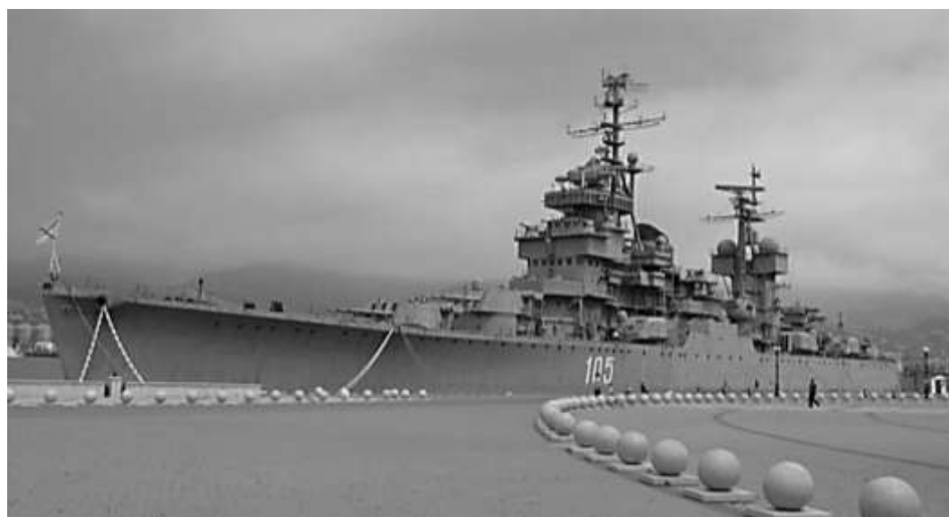
Новороссийск. Крейсер Михаил Кутузов