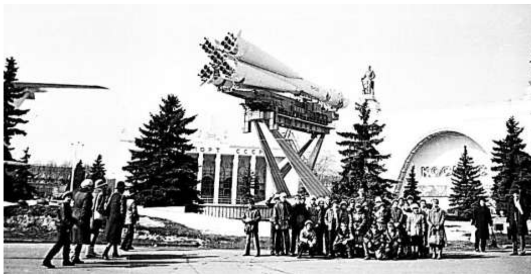
Экскурсия учеников 5а класса школы № 9 Димитровграда на родину героев-красноармейцев