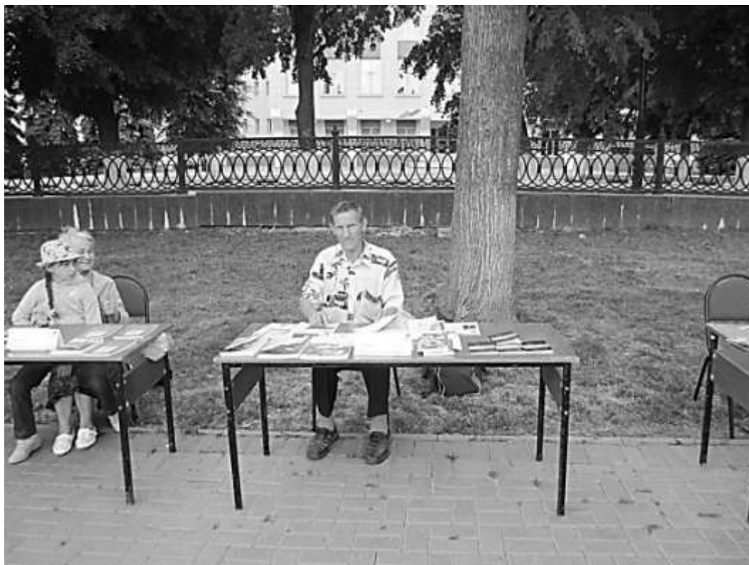
День письменности на Венце в г. Ульяновске