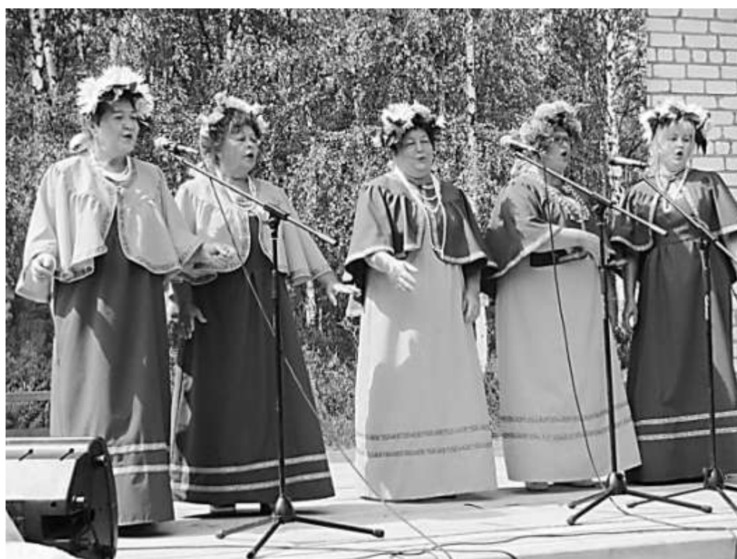
Культурная программа фестиваля