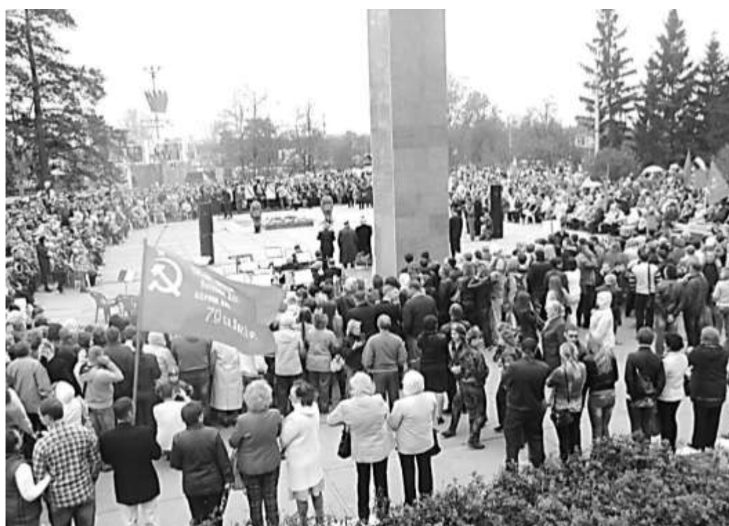
9 мая в Димитровграде