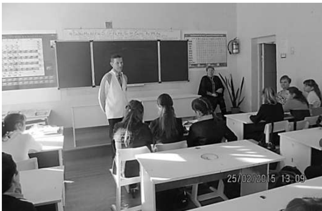
В школе села Лесная Хмельовка