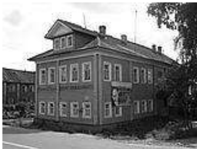
Дом в Емецке, где родился Николай Рубцов

В 1968 году литературные заслуги Рубцова получили официальное признание и ему в Вологде была выделена однокомнатная квартира № 66 на четвёртом этаже в пятиэтажном доме № 3 на улице, названной именем другого вологодского