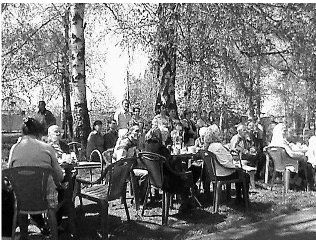
День Победы в Березовой роще у памятника Н.Ф. Ватутина