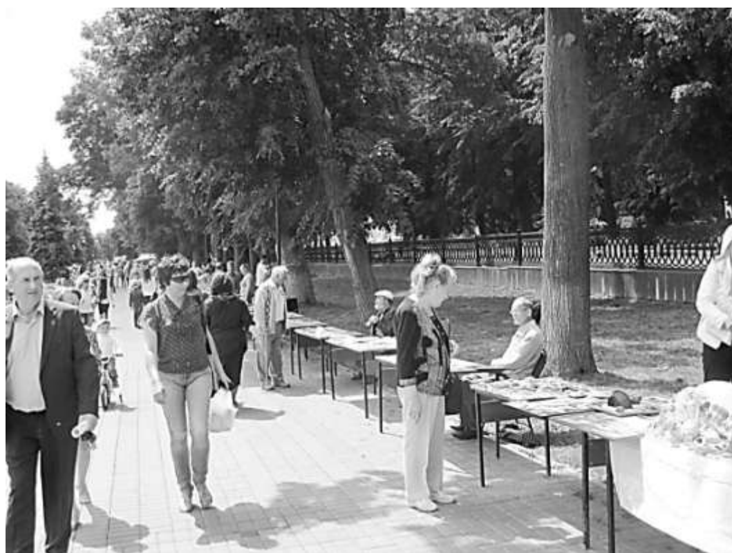
День письменности на Венце в г. Ульяновске