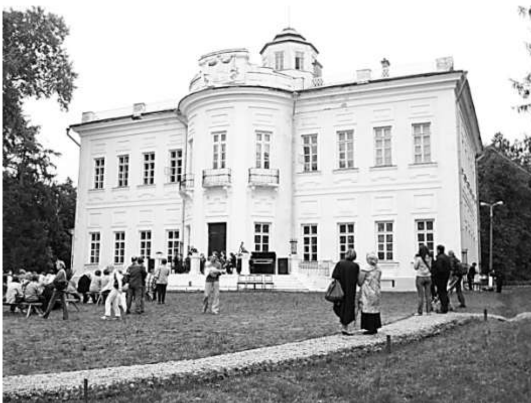
Заповедник «Усадьба Вязём»