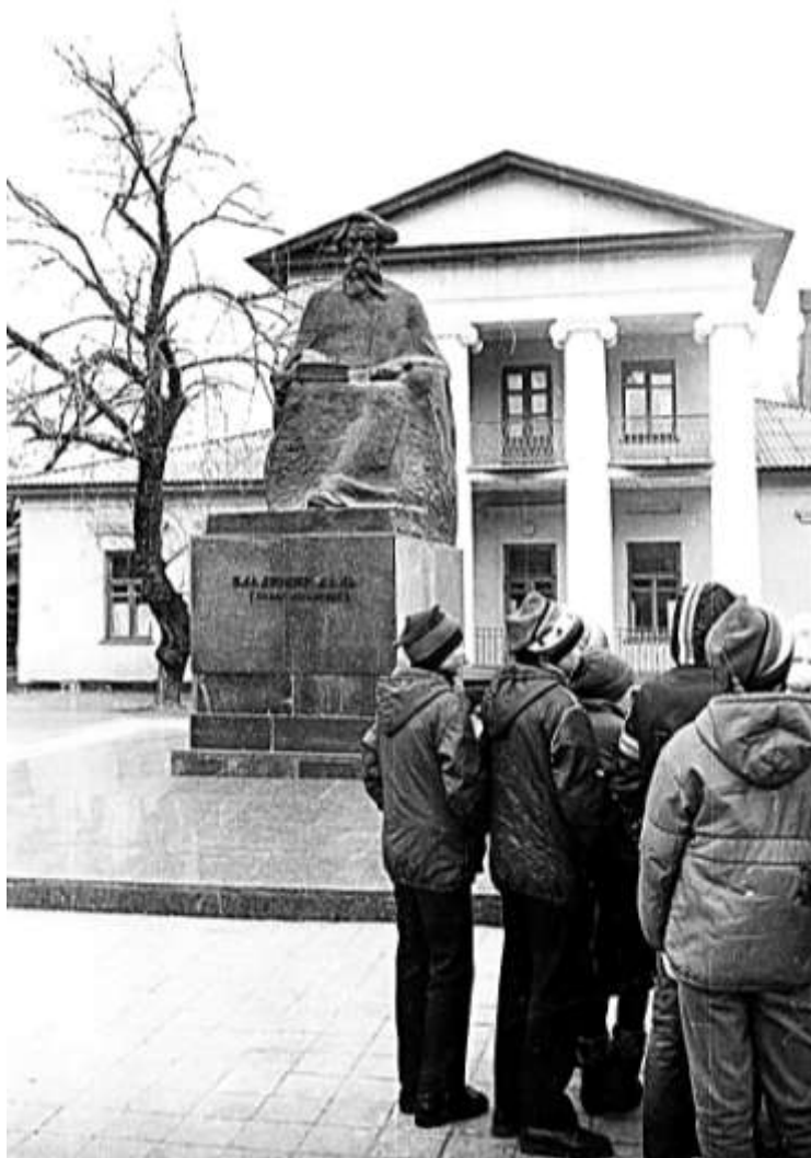
У памятника В. Далю, Ворошиловград

Помимо показа экспозиции, в залах на Поклонной горе ведется научная и просветительская работа, здесь проводят мероприятия по воспитанию у подрастающего поколения патриотических чувств и организуют тематические выставки по случаю знаменательных дат.