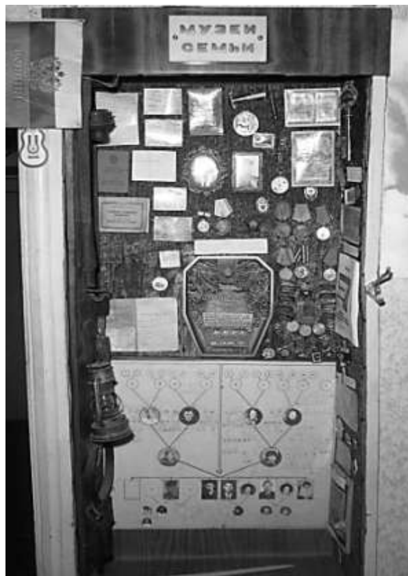
Домашний «Музей семьи»

Благодарность в приказе от 31.07.1945 г. "... Вы подлежите демобилизации и переходите на мирный труд на благо страны..." за подписью Главнокомандующего Советскими оккупационными войсками в Германии Маршала Советского Союза Г.К. Жукова.