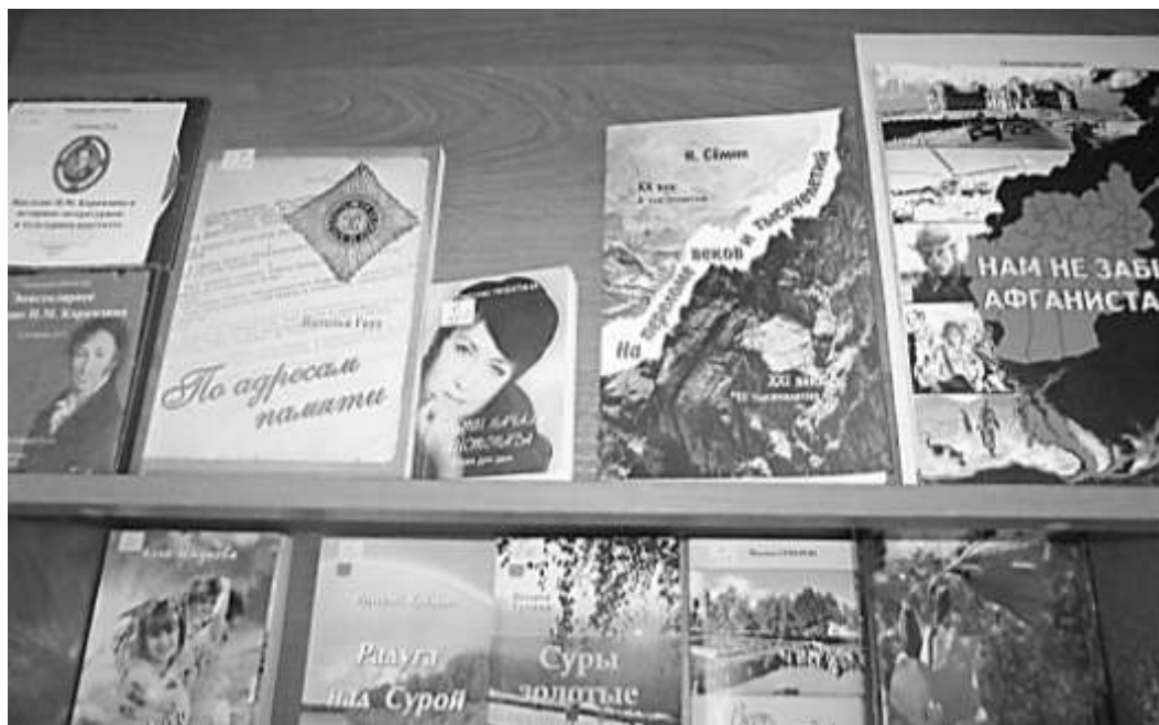
На стендах книги димитровградских писателей

ский государственный архив новейшей истории, за издание календаря «Ульяновцы на полях великих сражений».