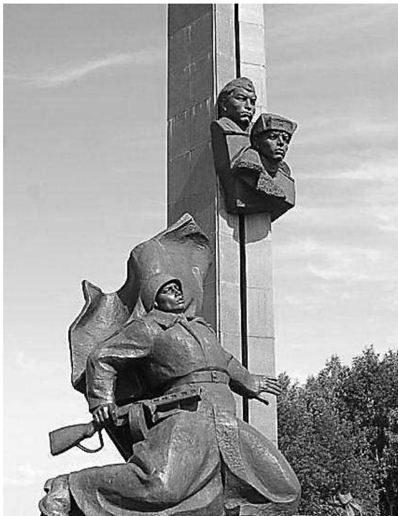
Памятник А. Матросову, г. Уфа

Но остаётся непреложным тот факт, что прививку патриотизма и силу духа он черпал из земли своей Родины, независимо от географических координат: Уфа, Саратов, Ульяновск, Мелекес, Куйбышев, Оренбург. С конечной точкой: деревня Чернушки, район Великие Луки, Псковская область, февраль 1943 года.