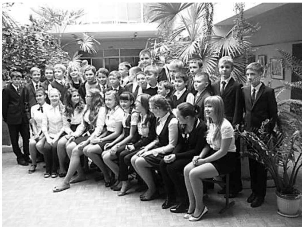
9-й класс городской гимназии перед поездкой в Болдино