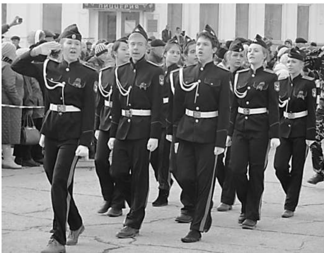
Площадь Советов. Парад Победы