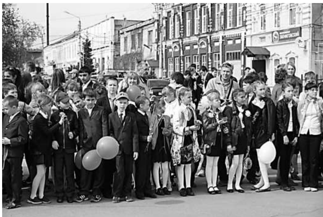
На открытии «Аллеи ветеранов»