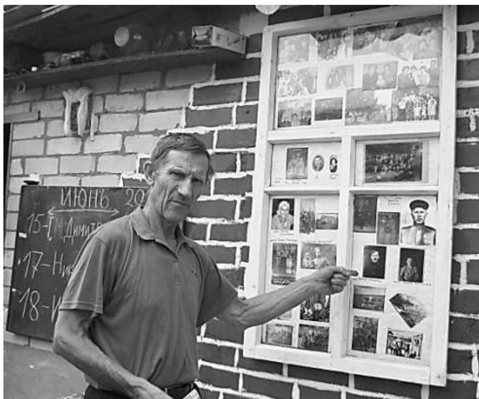
«Окно в прошлое» во дворе дома