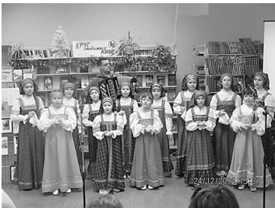
В библиотеке семейного чтения имени Александра Неверова