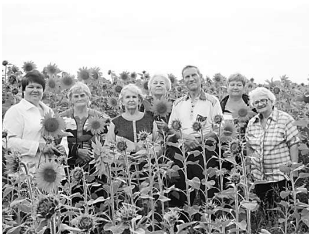
Коллектив «Берегиня» (г. Димитровград)