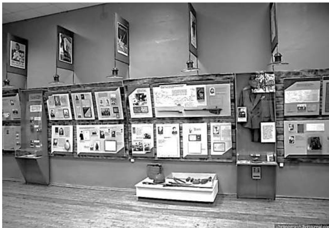
«Зал Славы» в Димитровградском краеведческом музее