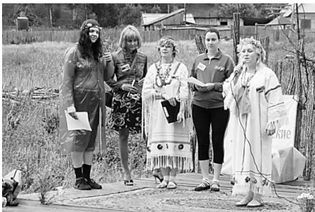
Гончаровские чтения в селе Лопата