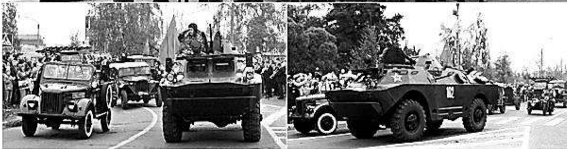
9 мая в Димитровграде